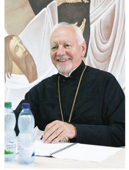
Синоди Івано-Франківської Митрополії у 2024 р. Б.