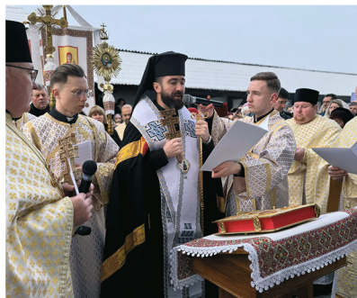
Відкриття Ювілейного 2025 року: Патріарший прокатедральний собор у с. Крилосі