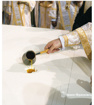
Посвячення престолу Архікатедрального і Митрополичого собору м. Івано-Франківська