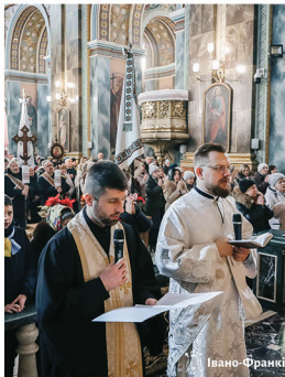
Відкриття Ювілейного 2025 року: Архікатедральний і Митрополичий собор в м. Івано-Франківську